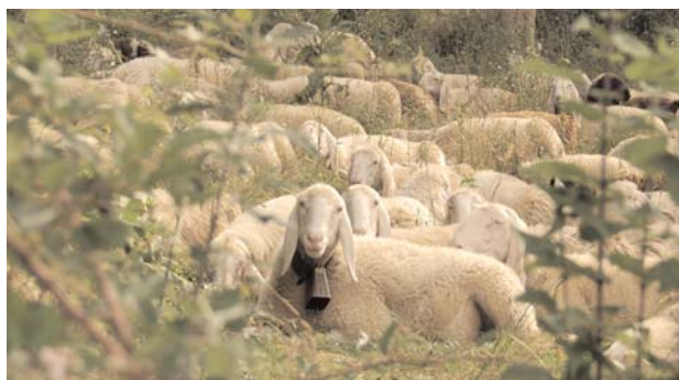
● Gregge al pascolo.

Locana è situata nel cuore del Parco del Gran Paradiso che si estende a cavallo fra la provincia di Torino (vallate dell'Orco e Soana) e la Val d'Aosta (Valli di Cogne, Savarenche, Rhêmes) con un'area di circa 70.000 ettari. Il parco, primo per istituzione in Italia, è dominato dalla grandiosità del massiccio gruppo del Gran Paradiso di cui la vetta più alta supera i 4.000 metri.