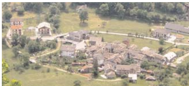
● Frazione di Pretolungo.

Per informazioni circa l'affitto e l'acquisto dei rustici nelle borgate, rivolgersi presso l'Ufficio Turistico di Locana.