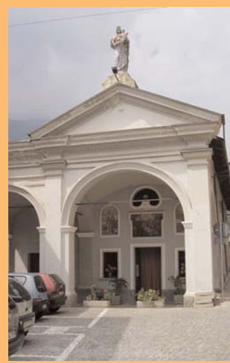
● Chiesa Cantellino.