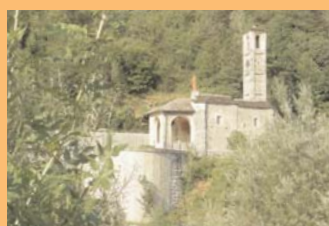
● Chiesa del Gurgo.