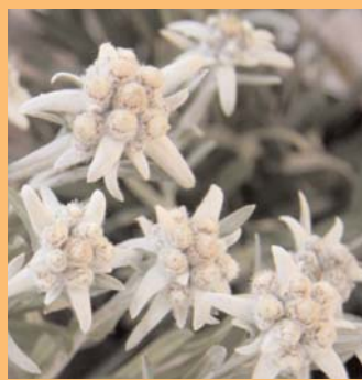
● Stella alpina.