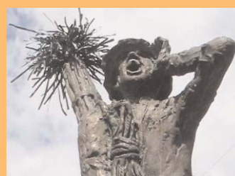
● Denkmal für den Schornsteinfeger.