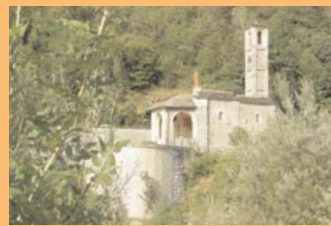
● Kirche Chiesa del Gurgo.