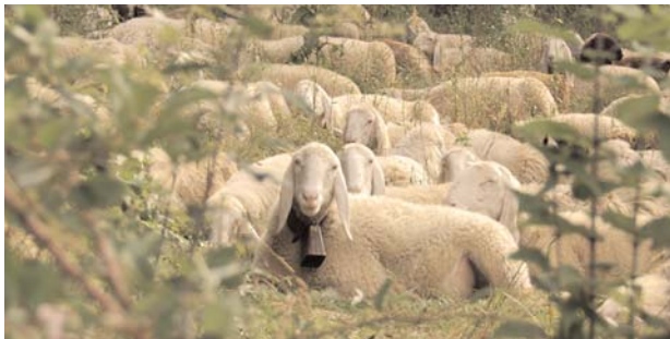
● Herde auf der Alm.

Locana befindet sich im Herzen des Nationalparks Gran Paradiso, der sich an der Grenze zwischen der Provinz Turin (Orco- und Soana-Tal) und dem Aostatal (Täler von Cogne, Savarenne und Rhêmes) über eine Fläche von rund 70.000 Hektar erstreckt. Er ist der älteste Nationalpark Italiens und wird vom mächtigen Bergmassiv des Gran Paradiso beherrscht, dessen höchster Gipfel über 4.000 Meter erreicht.