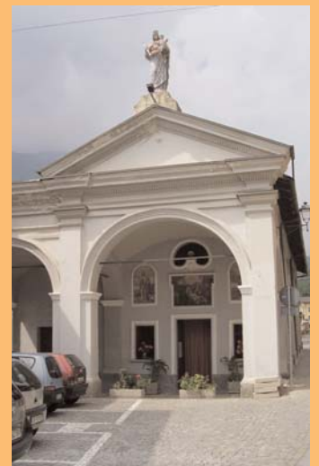
● Kirche Cantellino.