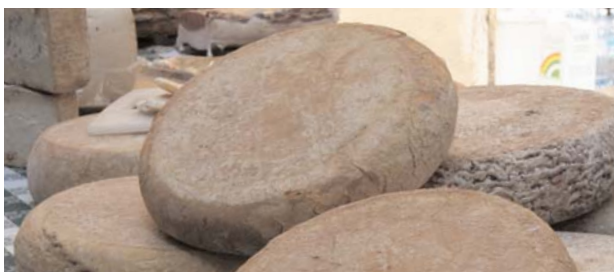
● Tome (Käsespezialität).

Feste, Kirchweihen, Veranstaltungen und Ausstellungen finden in großer Zahl das ganze Jahr über in Locana und seinem Tal statt. Neben Sport- und Kulturveranstaltungen werden die örtlichen Berufe und die lokalen Spezialitäten gefeiert, vom Schornsteinfeger bis zu den Kastanien, während andere Festtage den Schutzheiligen oder Pilgerfahrten zu den antiken Wallfahrtsorten in den Bergen gewidmet sind.