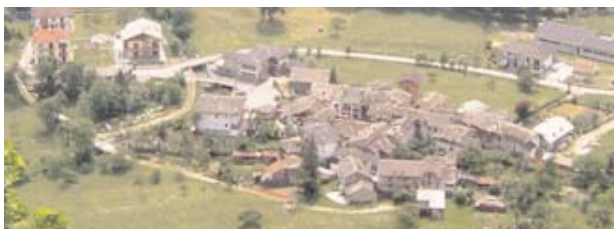
● Ortsteil Pretolungo.

Locana hält einen einzigartigen Rekord: Das Gemeindegebiet umfasst 90 Dörfer, die in früheren Jahrhunderten in 10 Herzogtümern vereint waren. Die Ortsnamen stammen aus dem Lateinischen und dem Langobardischen, andere gehen auf die Lehenszeit zurück oder verweisen auf Namen von Bäumen. Informationen zu Vermietung und Verkauf von rustikalen Häusern in den Dörfern erhalten Sie beim Fremdenverkehrsamt in Locana.