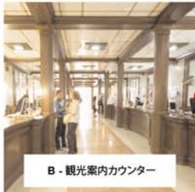
B - 観光案内カウンター