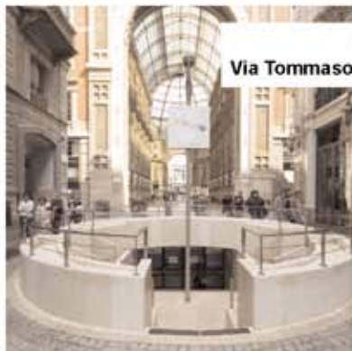
E Via Tommaso Grossi 側入り口