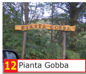
12 Pianta Gobba