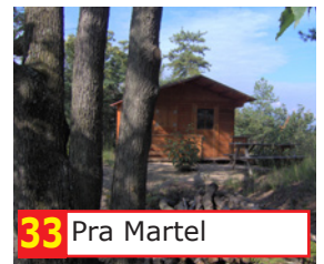
33 Pra Martel

Personal Guide da ascoltare sul tuo lettore mp3: