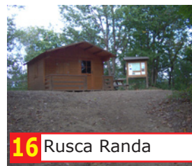
16 Rusca Randa