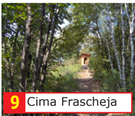
9 Cima Frascheja