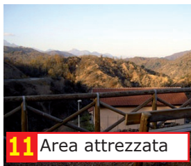
11 Area attrezzata