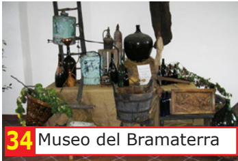
34 Museo del Bramaterra

Visitiamo insieme tre punti di interesse storico e artistico a Roasio: le audioguide Personal Guide vi accompagneranno illustrandovi i monumenti.