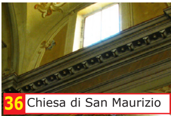
36 Chiesa di San Maurizio