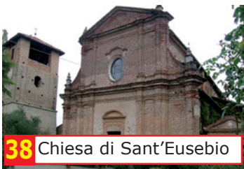
38 Chiesa di Sant'Eusebio

La numerazione dei file Personal Guide mp3 segue quella riportata nella cartografia della Comunità Collinare.