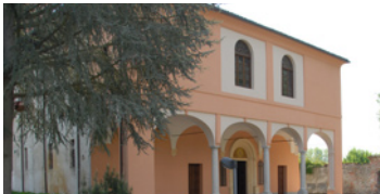
24 Santuario di Rado