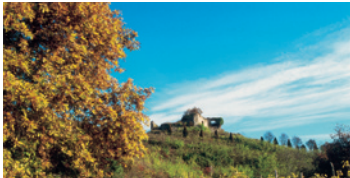
19 Castello di San Lorenzo

Visitiamo insieme sette punti di interesse storico e artistico a Gattinara: le audioguide Personal Guide vi accompagneranno illustrandovi i monumenti.