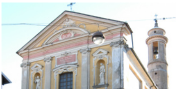
29 Madonna del Rosario