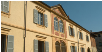
26 Villa Paolotti