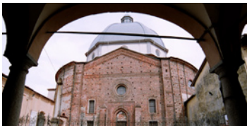
31 Parrocchiale San Pietro