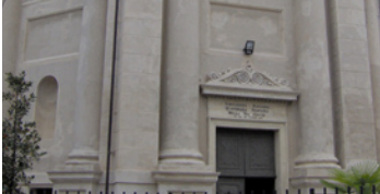
30 Chiesa di Santa Marta

La numerazione dei file Personal Guide mp3 segue quella riportata nella cartografia della Comunità Collinare.