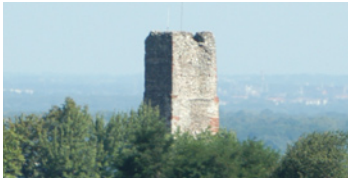
22 Torre delle Castelle