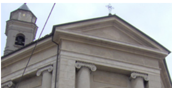
30 Chiesa di Santa Marta